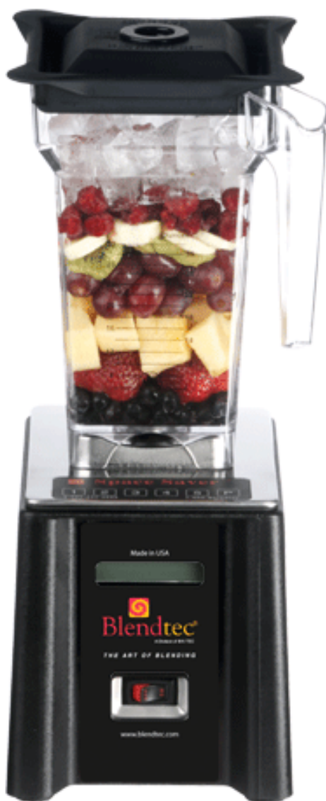
Профессиональный блендер Blendtec SpaceSaver Руководство пользователя.